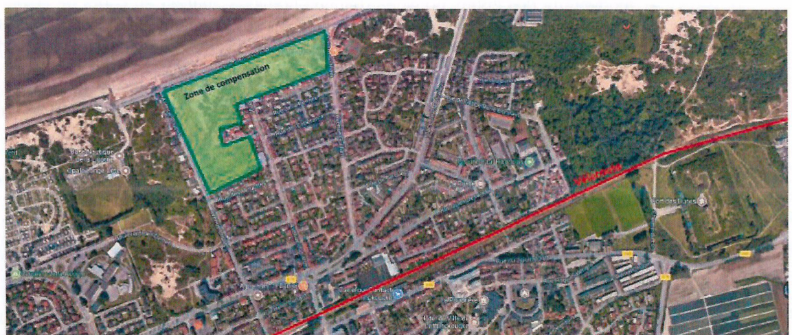
Carte de localisation : mesure compensatoire et tracé de la Véloroute Voie Verte