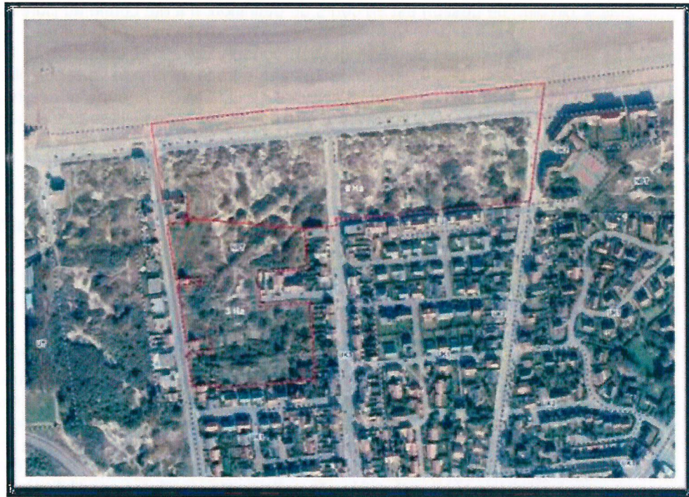
Carte de localisation : mesure compensatoire