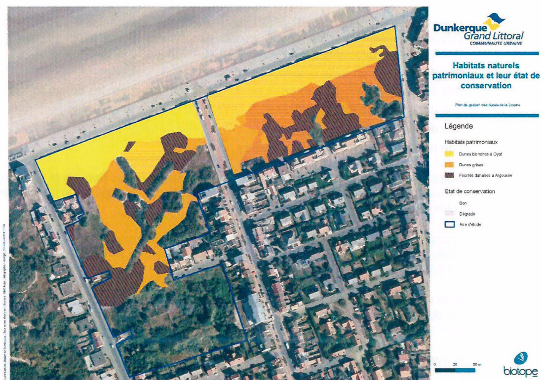
Carte extraite d'un premier rendu du travail du cabinet Biotope concernant les habitats patrimoniaux du site de la Licorne

La carte suivante est un extrait du premier rendu du travail du cabinet Biotope concernant les habitats patrimoniaux du site de la Licorne.